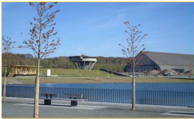
- 공원 사진(기념관 앞 호수) -