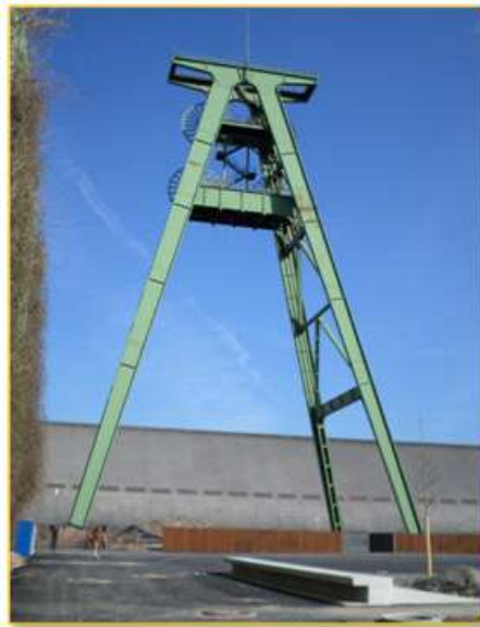
- 철 탑(보강하여 설치미술 작품으로 만들 예정) -