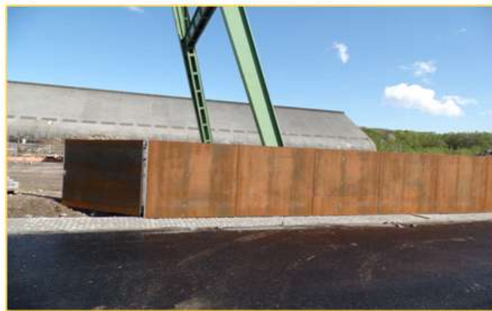
- 전시 활용 벽체(한국역사·문화·경제에 관한 스토리 전시 예정) -