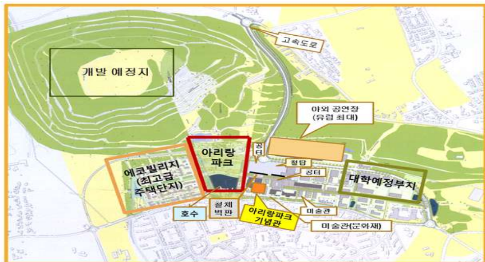
- 개발계획도 -