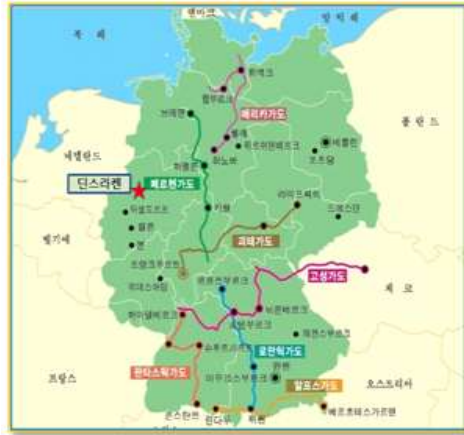
- 독일 지도 -