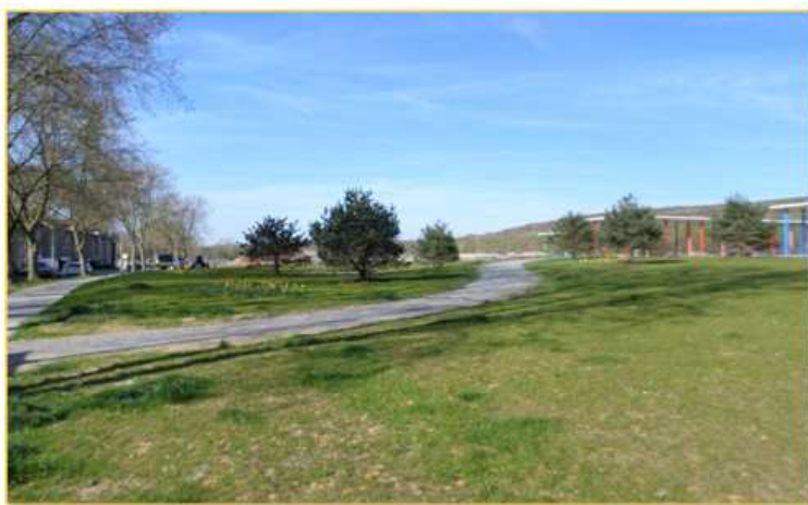
- 공원 사진 (공원 입구) -