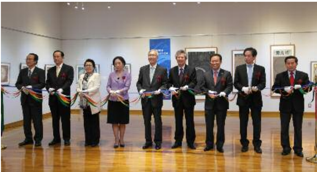
‘아름다운 세계 고지도’ 전 개막식 장면

향후 혜정박물관은 일본, 중국, 대만과의 고지도 관련 네트워크를 강화하기 위한 학술협력사업을 펼쳐 나갈 계획입니다. 또한, 이번 행사처럼 해외 전시회도 지속적으로 준비하여 세계 속에 한국의 위상을 높이는 박물관이 되도록 노력할 것을 약속드립니다. 계속해서 관심을 갖고 적극적인 호응과 격려를 부탁드립니다.