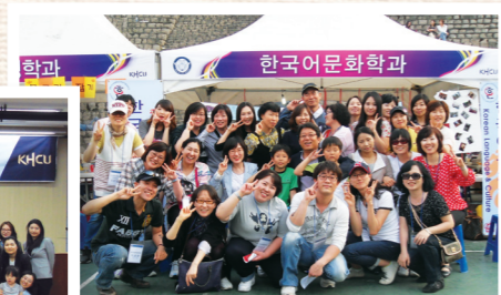
KHCU Festival (2012. 05)