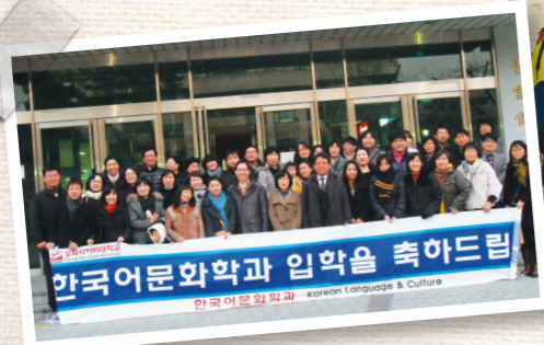
2012학년도 전기 입학식 (2012. 02)