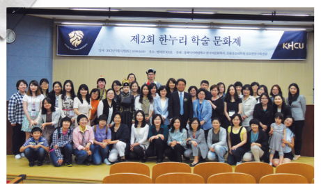
제2회 한누리 학술제 (2012. 05)