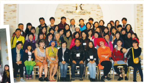
물오름달 모꼬지 (2012. 03)