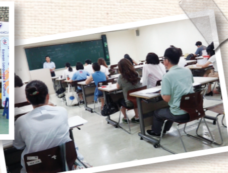
토픽 특강 및 워크숍 (2012. 07)